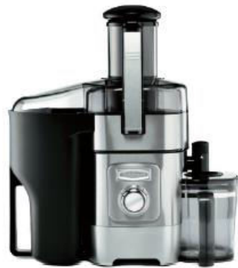
Centrifugeuse Juice extractor